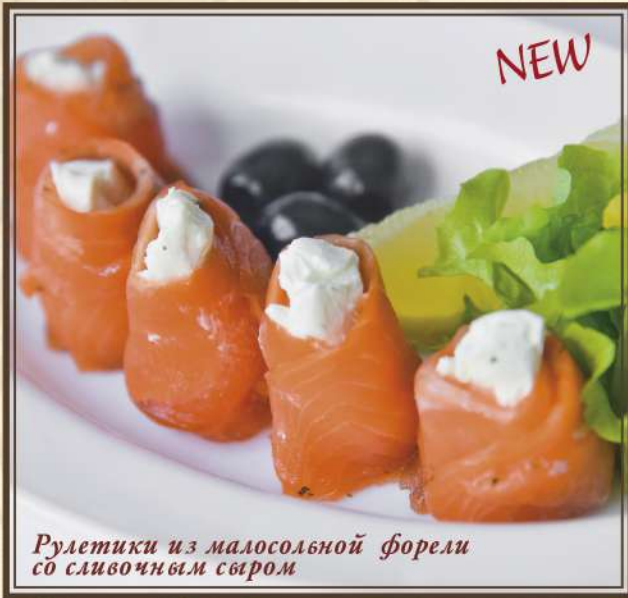
Рулетики из малосольной форели со сливочным сыром