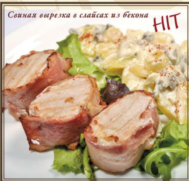
Свинная вырезка в слайсах из бекона