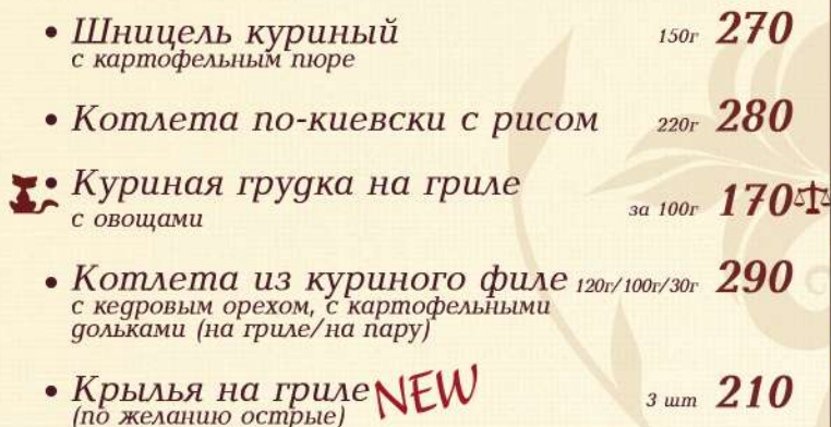
Куриная грудка на гриле