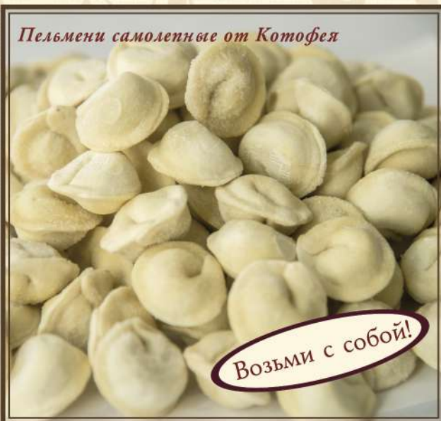
Пельмени самолепные от Котофея