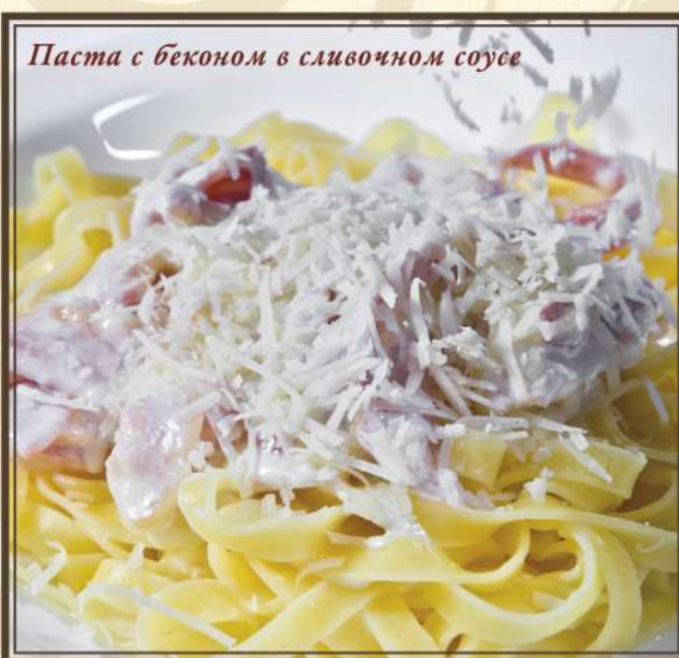
Паста с беконом в сливочном соусе